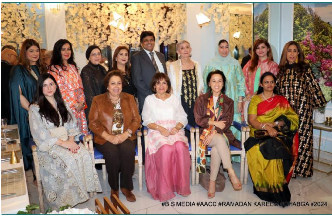
#B S MEDIA #AACC #RAMADAN KAREEM #GHABGA #2024