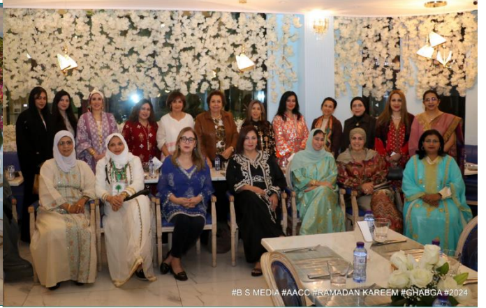
#B S MEDIA #AACC #RAMADAN KAREEM #GHABGA #2024

٢٥ مارس ٢٠٢٤ - أقامت المنظمة الهندية للتجارة والاقتصاد برئاسة الدكتور آصف إقبال غبقة رمضانية في مطعم عائشة بهلول في العدلية بالتعاون مع جمعية سيدات الأعمال البحرينية، علماً بأن الجمعية وقعت مذكرة تفاهم للتعاون في عام ٢٠١٩ وتنظيم الجمعية لقاءات ثنائية في مملكة البحرين وجمهورية الهند مرتين في كل عام، ودعوة عدد من المسؤولين والدبلوماسيين ورجال الأعمال وممثلين من مختلف القطاعات في المجتمع ورواد الأعمال. أقيمت هذه الغبقة بمناسبة زيارة وفد من منظمة التجارة الاقتصادية الهندية، مملكة البحرين، خلال الفترة من ٢٤ حتى ال ٢٦ من مارس، وضم ١٣ عضواً من المنظمة، على رأسهم سفير جمهورية الهند السابق إلى مملكة البحرين بالكريشنا شيتي.