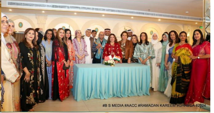
#B S MEDIA #AACC #RAMADAN KAREEM #GHABGA #2024