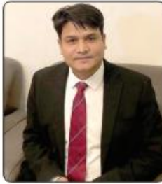
القائم بأعمال سفير بنغلاديش