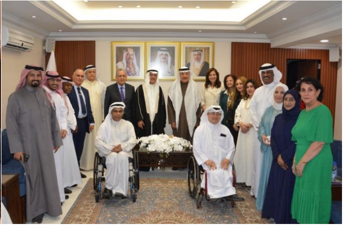
١٤ مارس ٢٠٢٤ - مجلس المحافظة الشمالية الرمضاني

14 March 2024 - Northern Governorate Ramadan Majlis