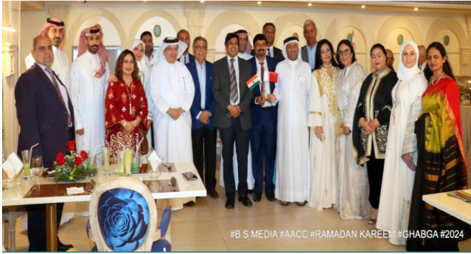
#B S MEDIA #AACC #RAMADAN KAREEM #GHABGA #2024