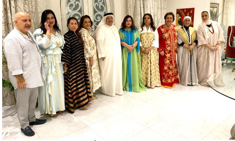
١٨ مارس ٢٠٢٤ - مجلس عائلة أجور الرمضاني

18 March 2024 – Ramadan Majlis of Ajoor Family