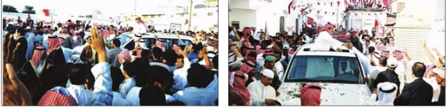
مناسبة وطنية مهمة لتقديم المزيد من العمل والعطاء... سيدات ورجال أعمال؛