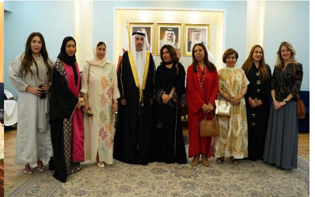
١٤ مارس ٢٠٢٤ - مجلس محافظة العاصمة الرمضاني

14 March 2024 - Ramadan Majlis of Capital Governorate