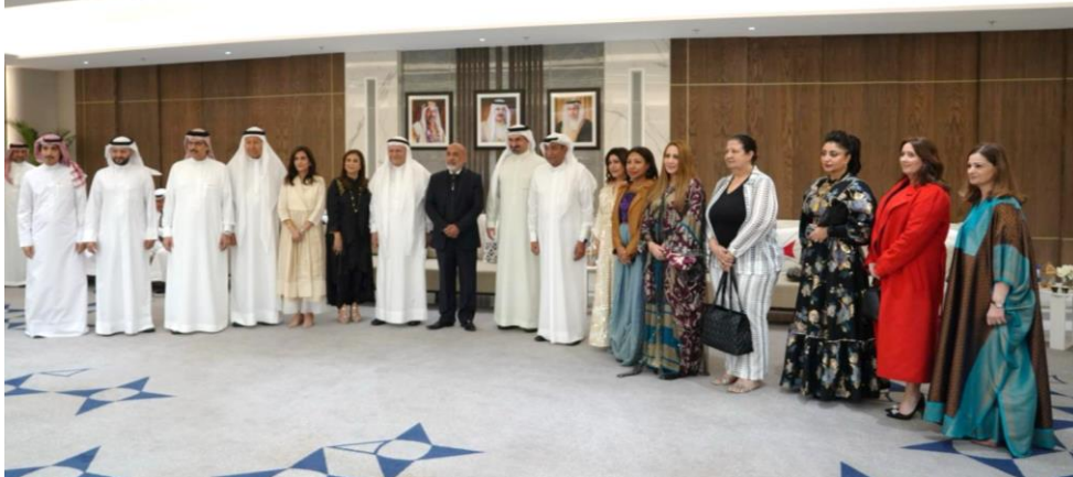
١٩ مارس ٢٠٢٤ - مجلس غرفة تجارة وصناعة البحرين الرمضاني 19 March 2024 - Ramadan Majlis of the Bahrain Chamber of Commerce and Industry